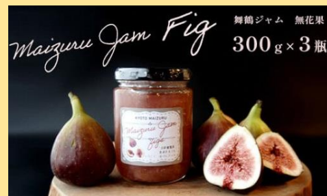
舞鶴ジャム 無花果 300g×3瓶