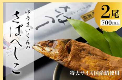
特大サイズ国産鯖使用